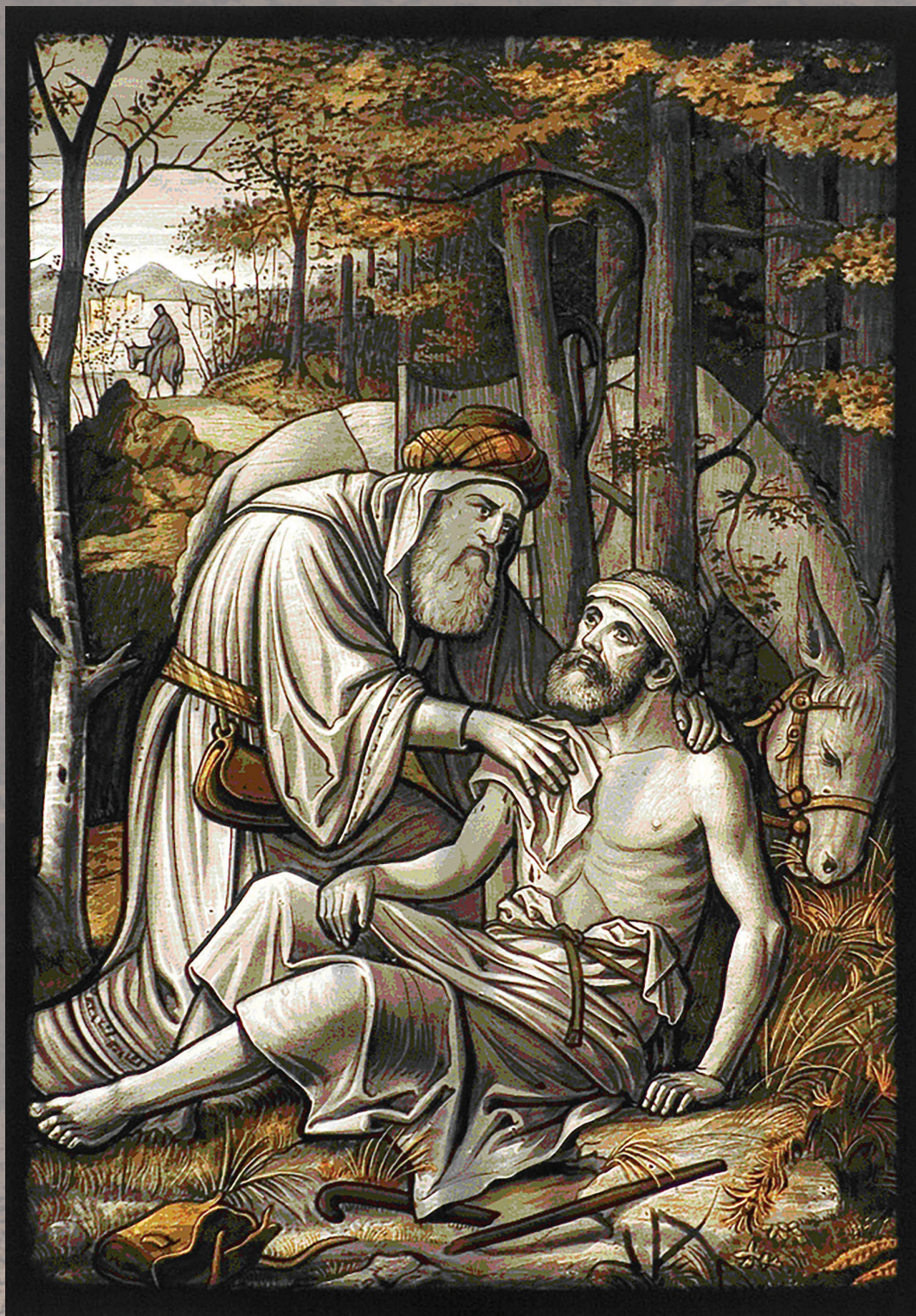
De barmhartige Samaritaan, kerkraam in de St. Lambertuskerk te Huisseling

Uitgave van de Protestantse Gemeente te St.-Oedenrode, Son en Breugel